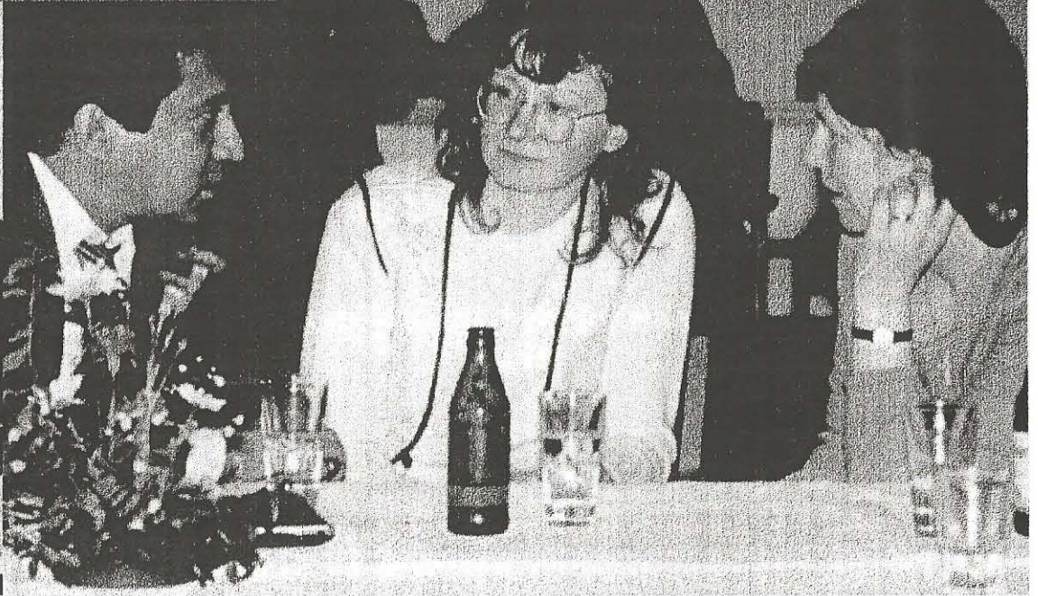
Kapiteltag in Stuttgart 1981 , Teil 2