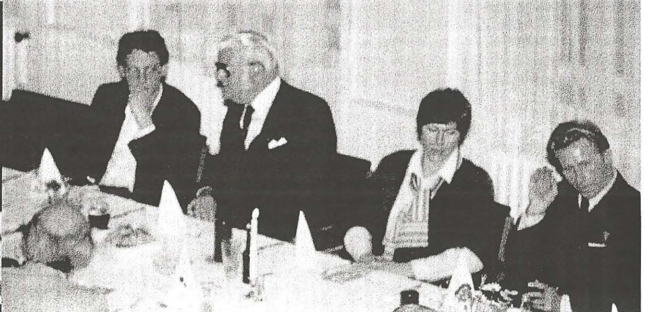
Kapiteltag in Stuttgart 1981 , Teil 1