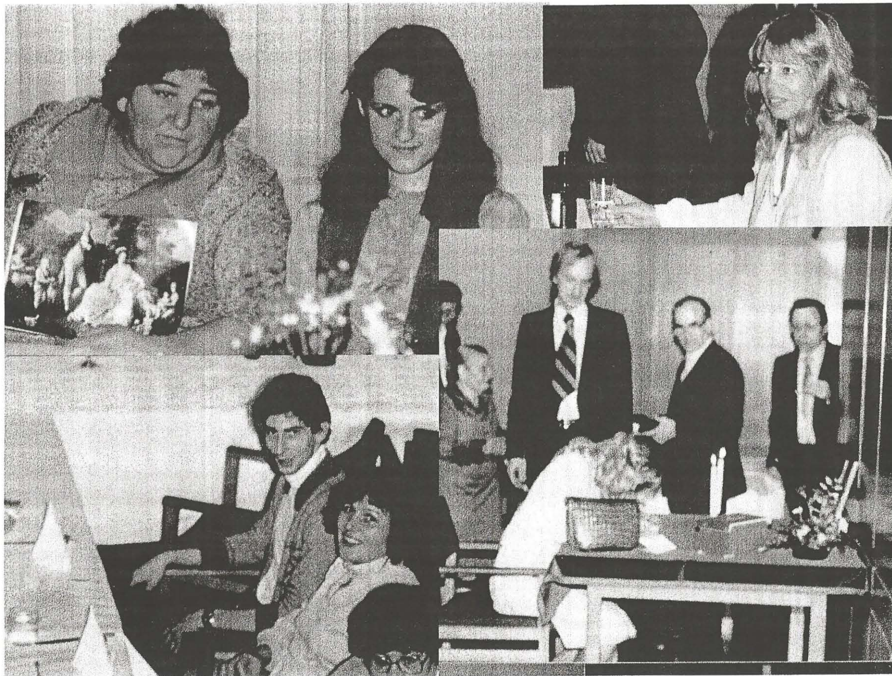
Kapiteltag in Stuttgart 1981 , Teil 3