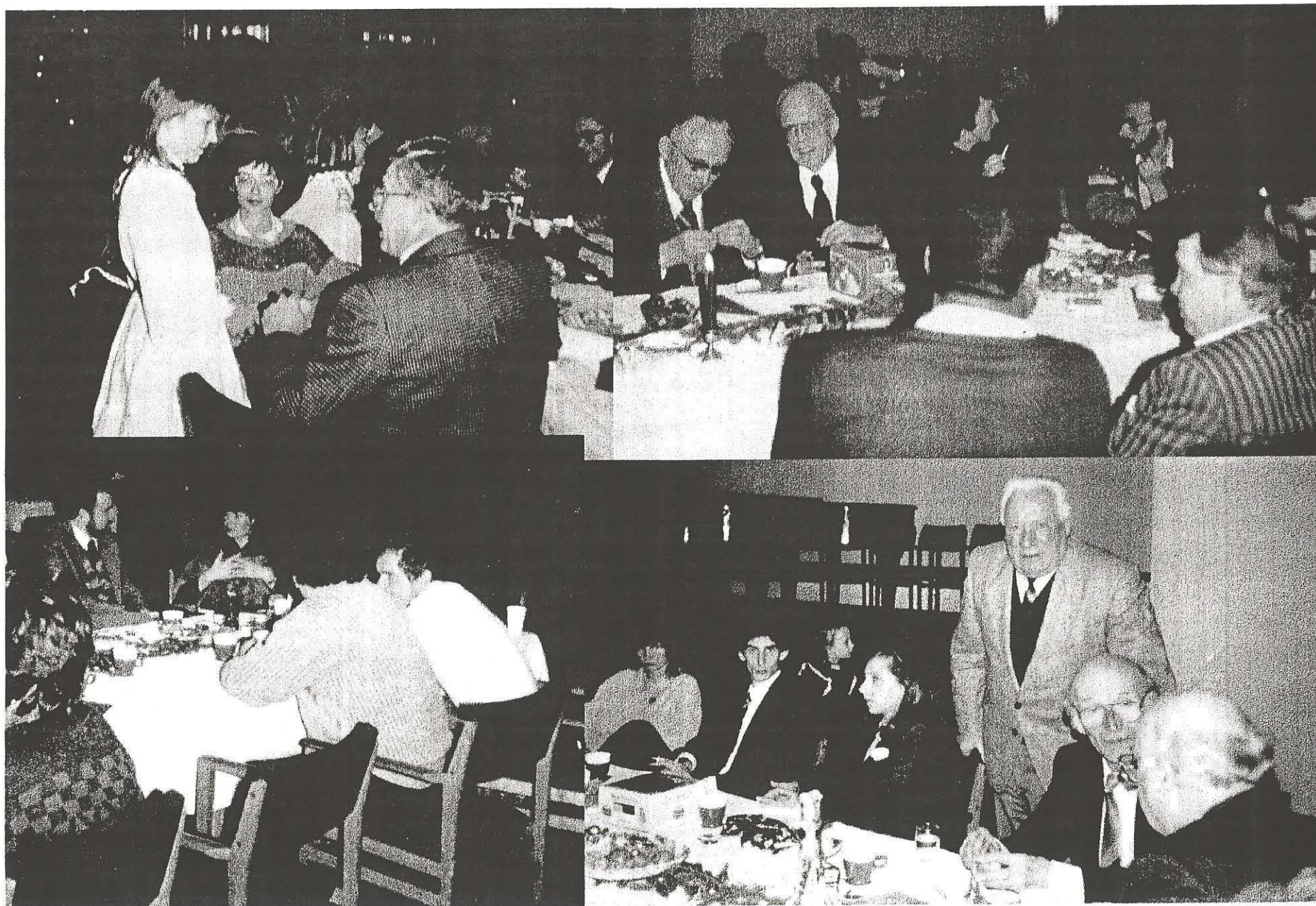
Lichtfest in Stuttgart, Dezember 1981