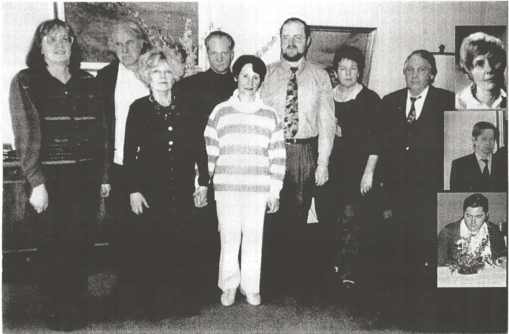
RC-Zirkel Stuttgart , 1. Zyklus , Februar 1994 - Februar 1997